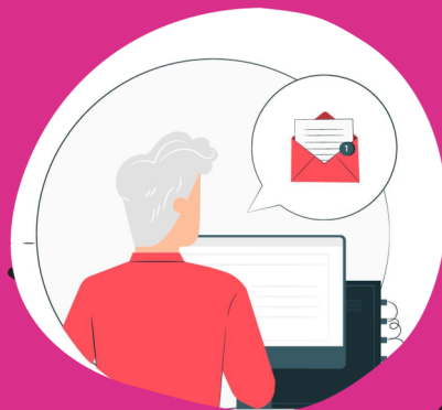
Dr Roger Médecin Généraliste

Pour chaque patient qui le nécessite, Pépites-Parcours permet d'élaborer un PPCS visant à identifier ses besoins et à planifier les actions d'aide ou de soins à mettre en place. Partagé avec l'ensemble des professionnels qui l'entourent, ce plan vise à améliorer le parcours de santé du patient en évitant les ruptures de prise en charge.