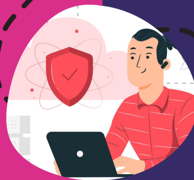
Fred Coordonnateur de parcours

Par le biais de l'application mobile Globule, les professionnels communiquent au sein d'un dossier patient de façon sécurisée.